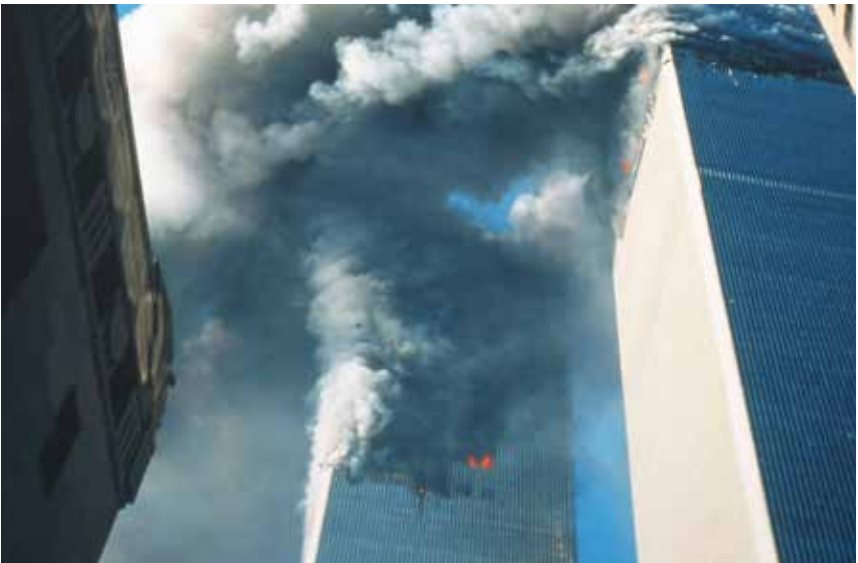
Die brennenden Türme des World Trade Centers in New York haben sich in das kollektive Gedächtnis eingeprägt. a

Gewalt und Machtlosigkeit sind in diesen Momenten nahe beieinander. Mancher Appell, manche Information und Aktion kommen aus dieser Situation heraus. Es gibt Bilder, die vergehen in der Bilderflut unserer Tage, ähnlich wie die Momentaufnahme, der Schnappschuss auf dem Handy. Und es gibt Bilder, die graben sich tief ein, Jahrhundertbilder: