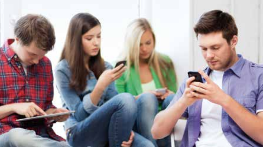
Unverzichtbare Begleiter im Alltag: Jugendliche mit ihren Smartphones und Tablets. c

Es geht also um Bilder, die unseren Alltag prägen. Die Bilder auf den Smartphones, die Bilder im Internet. Nicht nur jüngeren Menschen erscheint es heute zunehmend selbstverständlich – Stichwort Facebook – Fotos von sich selbst weltweit zu verbreiten, über diese Bilder mit anderen Menschen in Kontakt zu treten und Alltäglichkeiten auszutauschen.