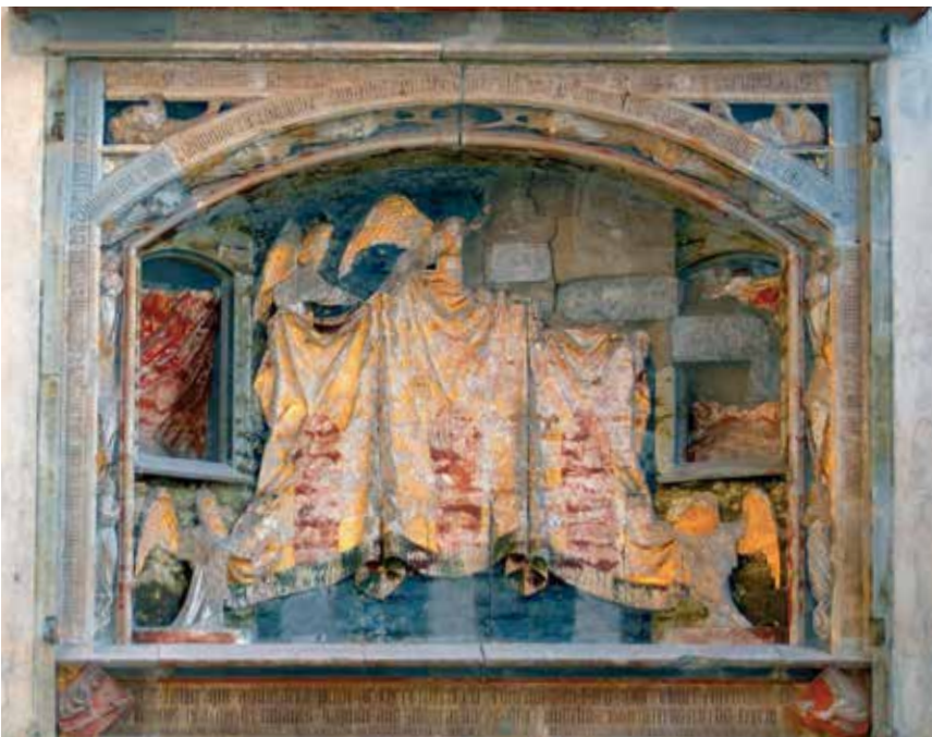
Die Skulpturen des Ulmer Karg-Retabels wurden im Zuge des Bildersturms im Juni 1531 zerstört. Der Altaraufsatz des Bildhauers Hans Multscher ist eine Stiftung von der Patrizierfamilie Karg. d

Bilder – vor allem im religiösen Zusammenhang – waren immer wieder einem Wechselspiel von tiefer Verehrung und heftiger Ablehnung ausgesetzt. Der Kampf gegen Bilder und Symbole, heilige Zeichen und Orte gehört nicht allein in die Erinnerung der christlichen Geschichte. Aber wir denken natürlich vor allem an die erbitterten Kämpfe im 8. und 9. Jahrhundert in der Ostkirche über die Rolle und Bedeutung der Bilder, wir denken an unsere Westkirche und den Bildersturm in manchen Orten und Augenblicken der Reformation.