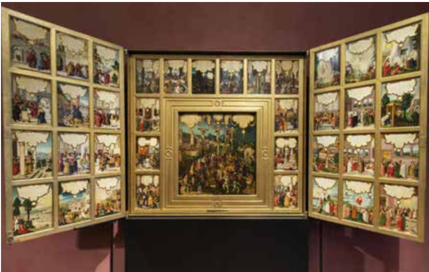
Der Mompelgarder Altar von Heinrich Füllmaurer, entstanden um 1540, befindet sich heute im Kunsthistorischen Museum Wien. Auf sechs doppelseitig bemalten Flügeln und einem Altarschrein wird in 157 Bildern das Leben und Wirken Jesu dargestellt. Auf jedem Bild ist in einer Kartusche der entsprechende Evangeliumstext zu lesen. Das Gesamtwerk liest sich wie eine überdimensionierte Bilderbibel. e

Die Gegenwartskunst in ihren autonomen Äußerungen ist für die Kirche als Gestalterin von Kultur eine unverzichtbare und willkommene Dialogpartnerin geworden, wo es um die Wahrnehmung und Deutung der Wirklichkeit geht und die Frage des rechten Handelns. Die Kirche teilt mit der Kunst den kritischen Umgang mit der heutigen medialen Bilderflut sowie die geschärfte Aufmerksamkeit für das, was in der Welt vorgeht und die Menschen bewegt. Ich komme darauf später in meinem Bischofsbericht zurück. Mir liegt die Wertschätzung der Kunst sehr am Herzen.